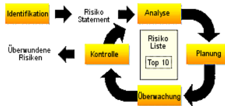
Abb. Risk Management Process

Proaktives Risikomanagement spielt eine zentrale Rolle während des gesamten Projektablaufs als Steuerungs- und Entscheidungsinstrument.