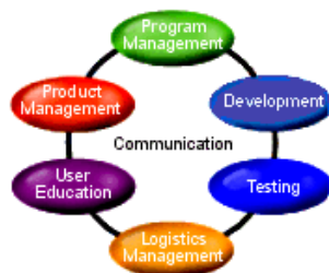
Abb. MSF Teammodell

Das MSF-Teammodell folgt dem Konzept eines Teams von gleichberechtigten Partnern mit untereinander abhängigen und kooperierenden Rollen. Jedes Teammitglied besitzt eine definierte Rolle innerhalb eines Projektes und ist auf die spezifische Mission fokussiert.