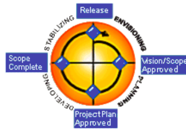
Abb. MSF Prozessmodell

MSF-Grundsätze eines erfolgreichen Prozesses: